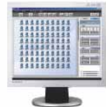
ML-500시스템 교사측 메인화면