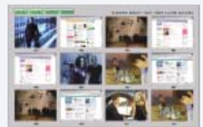
학생 감독 화면